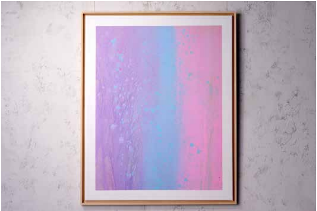
„DREAMLAND“ Acrylic and Spray Paint on Canvas / 80 x 100 cm / 2025