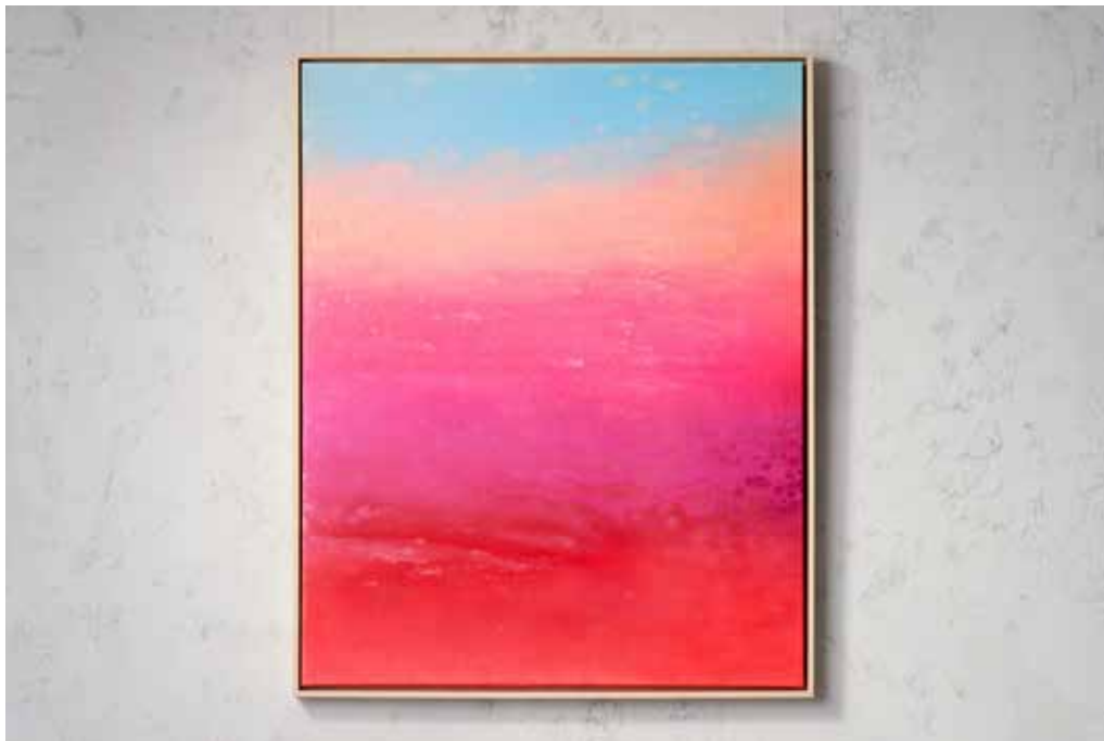
„SUNRISE IN PARADISE“

Acrylic and Spray Paint on Canvas / 80 x 100 cm / 2025