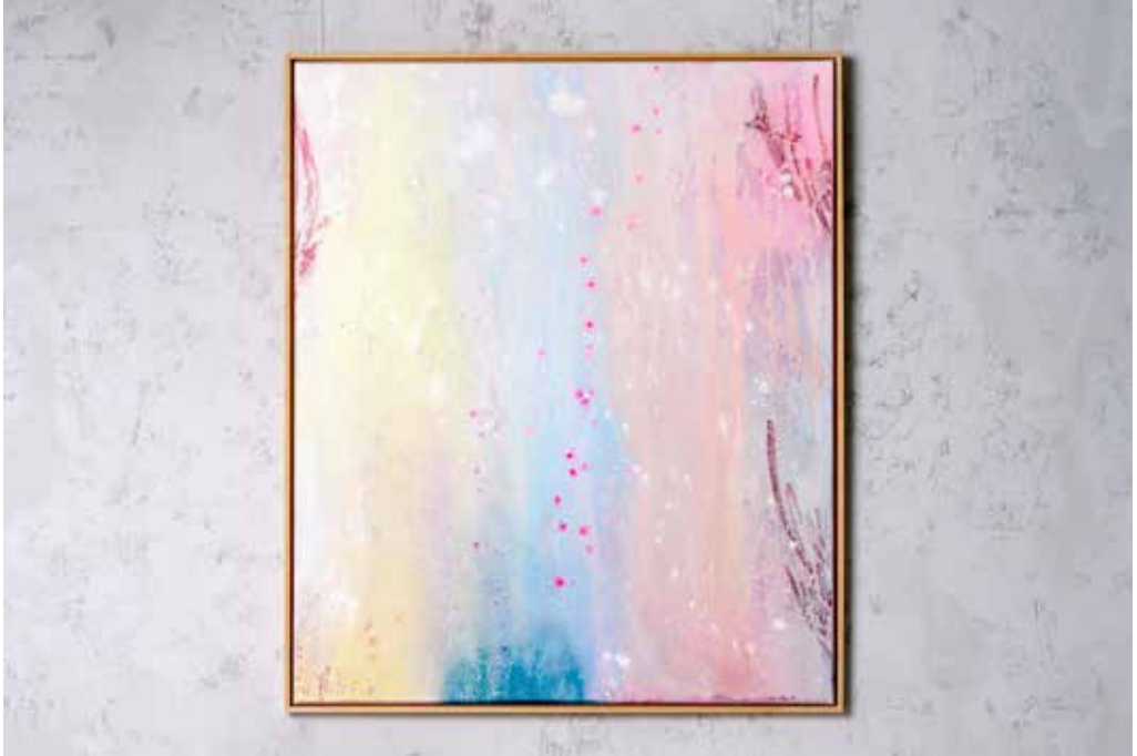
„BRIGHT COSMOS NO. 1“

Acrylic, Spray Paint and Lipstick on Canvas / 100 x 120 cm / 2025