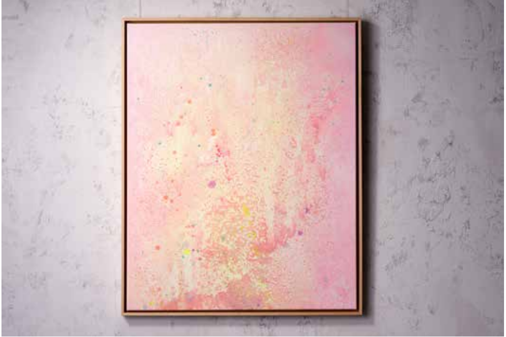
„SOFT BLOOM“ (SOLD)

Acrylic and Spray Paint on Canvas / 80 x 100 cm / 2025