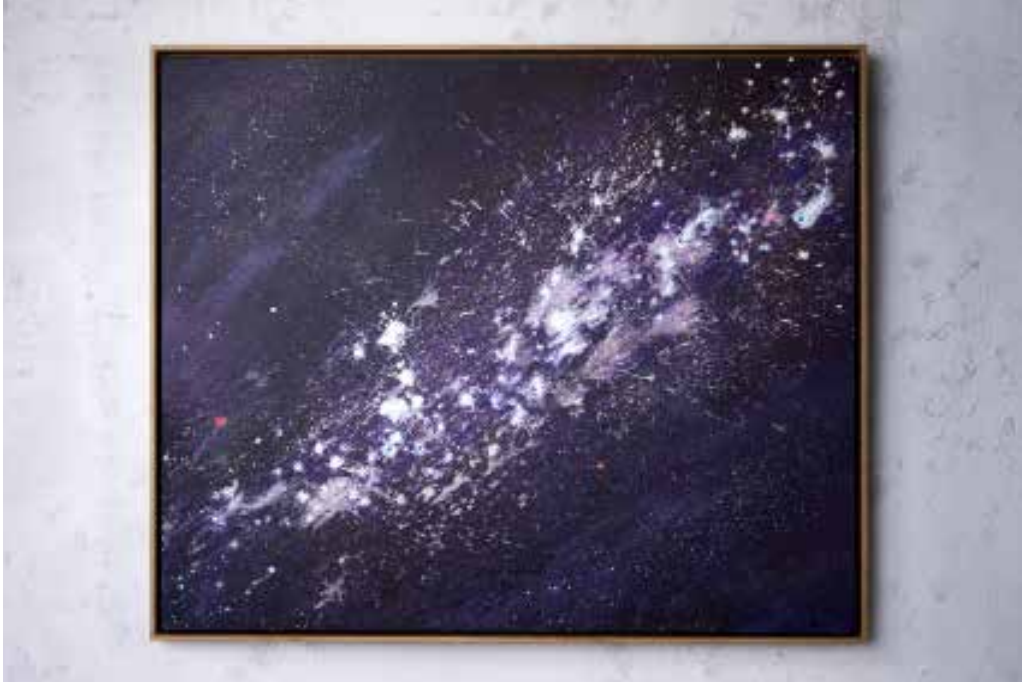
„MILKY WAY“ (SOLD)

Acrylic and Spray Paint on Canvas / 120 x 100 cm / 2024