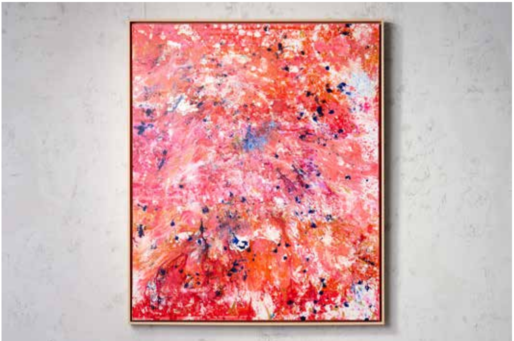
„TBA“ Acrylic and Spray Paint on Canvas / 100 x 120 cm / 2023