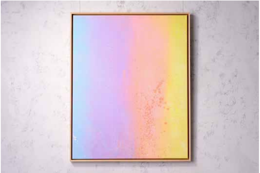
„WHEN DREAMS COME TRUE“ Acrylic and Spray Paint on Canvas / 80 x 100 cm / 2025