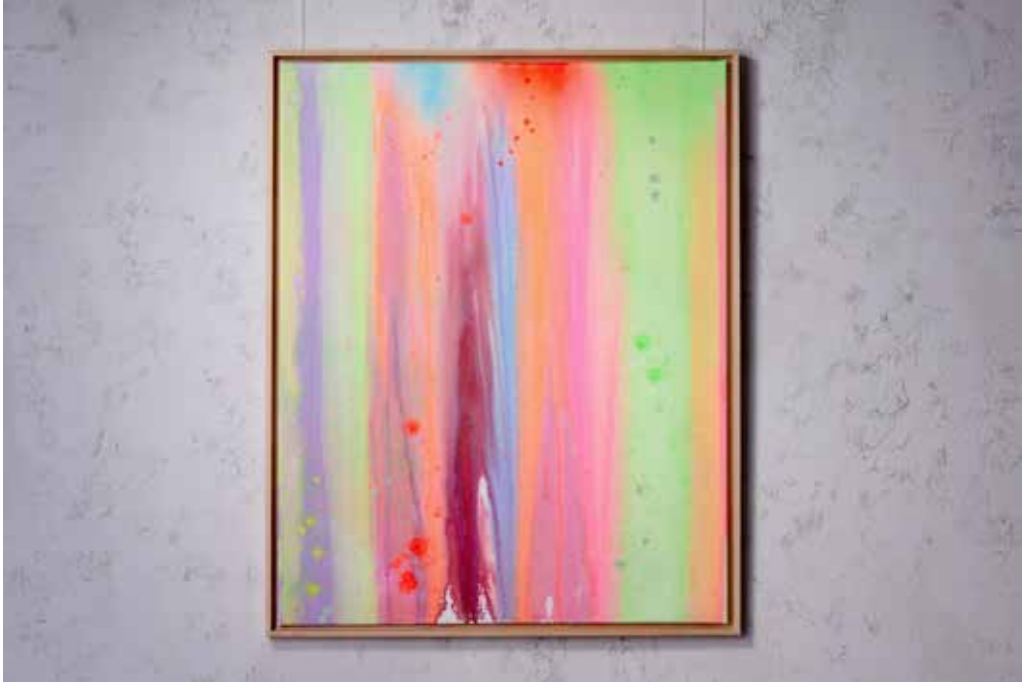
„FLAMBOYANT NO. 2“ Acrylic and Spray Paint on Canvas / 80 x 100 cm / 2025