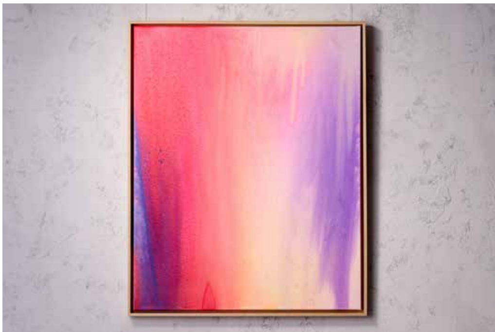
„RUBY NO. 1“ (SOLD)

Acrylic and Spray Paint on Canvas / 80 x 100 cm / 2025