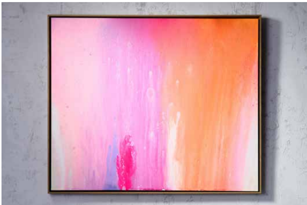
„WHEN THE SUN GOES DOWN“

Acrylic and Spray Paint on Canvas / 120 x 100 cm / 2024