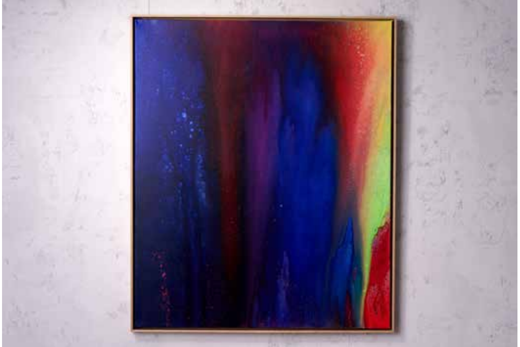
„GRAVITY BLOOM“ Acrylic and Spray Paint on Canvas / 100 x 120 cm / 2025