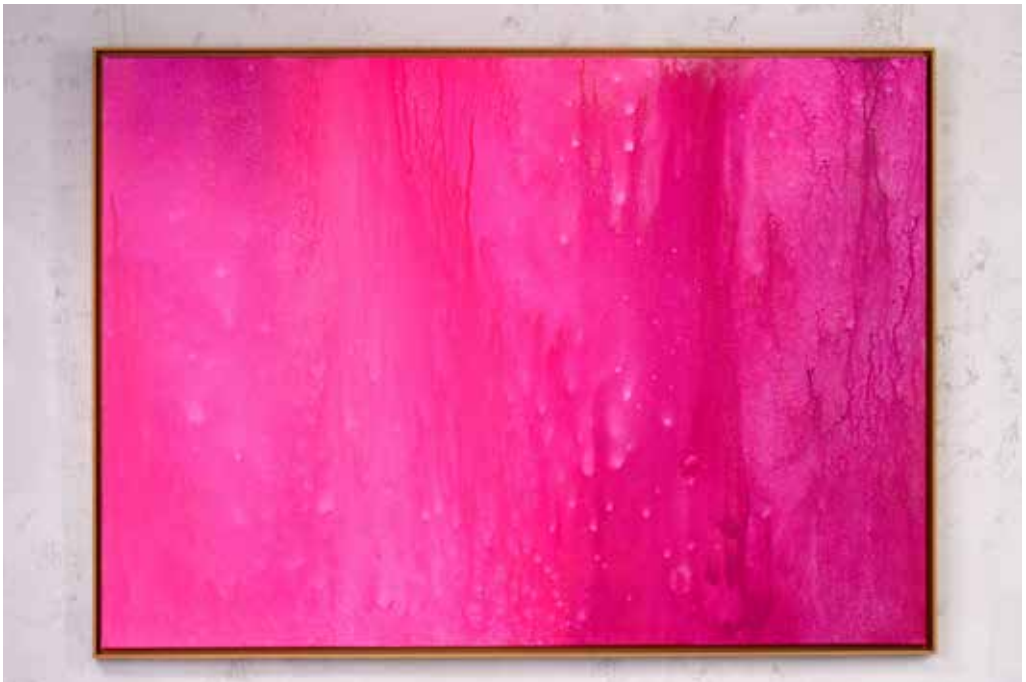
„MAGENTA“ Acrylic and Spray Paint on Canvas / 140 x 100 cm / 2024