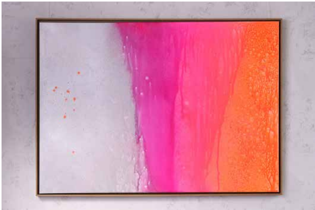
„THE SALT ON HER CHEEKS“

Acrylic and Spray Paint on Canvas / 140 x 100 cm / 2023