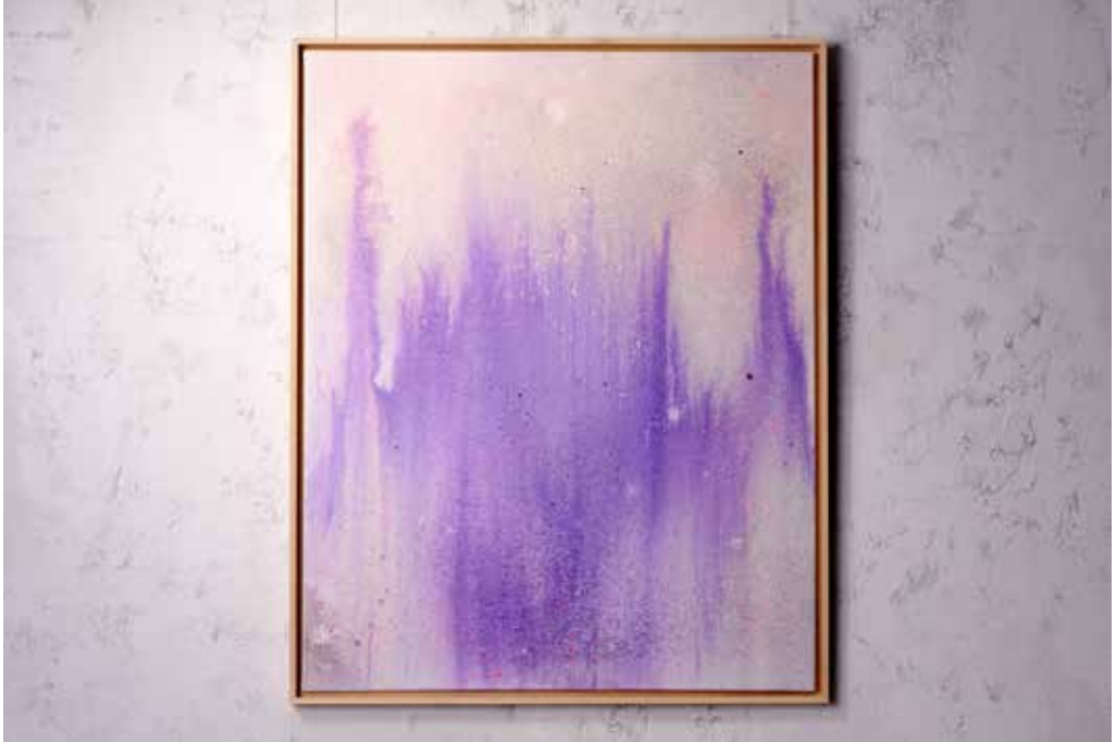
„LAVENDER FLAMES“ Acrylic and Spray Paint on Canvas / 80 x 100 cm / 2024