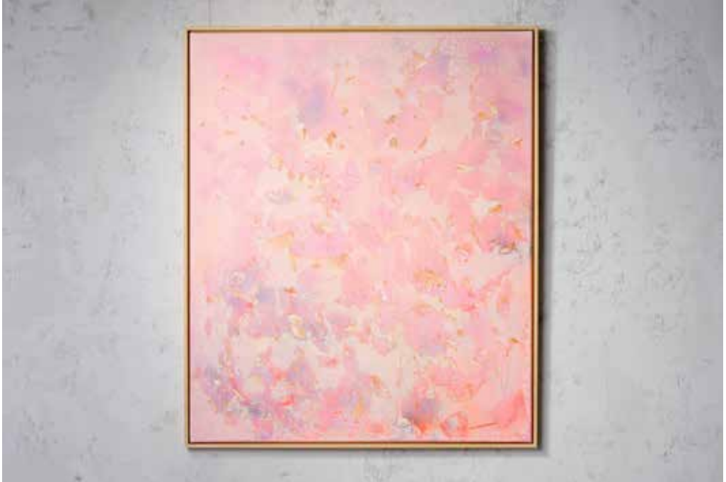
„INDIAN SUMMER NO. 1“ Acrylic, Spray Paint and Autumn Leaves on Canvas / 100 x 120 cm / 2025