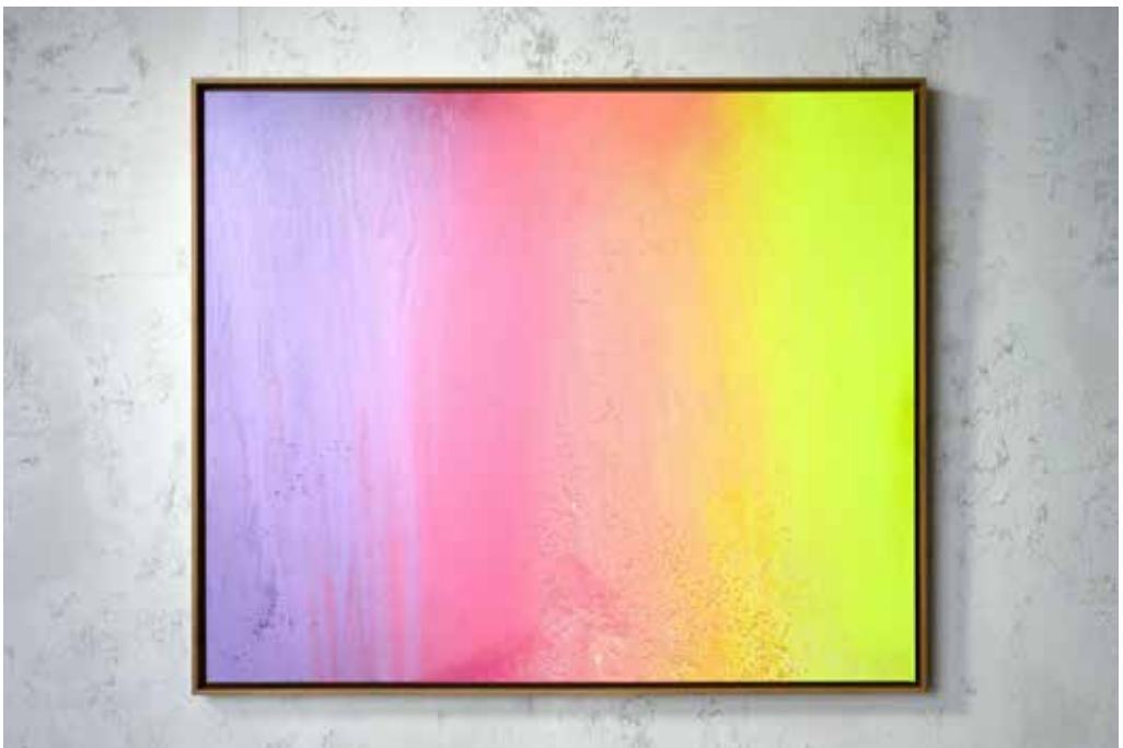
„APRIL“ Acrylic and Spray Paint on Canvas / 120 x 100 cm / 2025