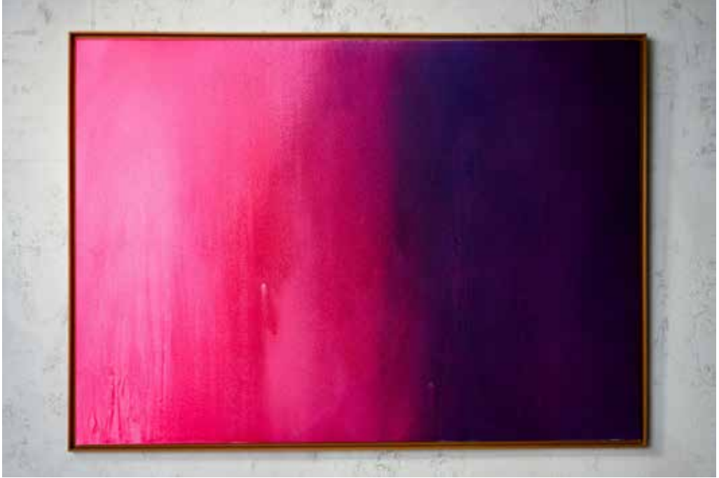
„AWAY“ Acrylic and Spray Paint on Canvas / 140 x 100 cm / 2024