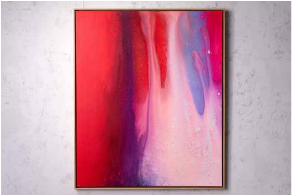
„AFTERGLOW“ Acrylic and Spray Paint on Canvas / 100 x 120 cm / 2025