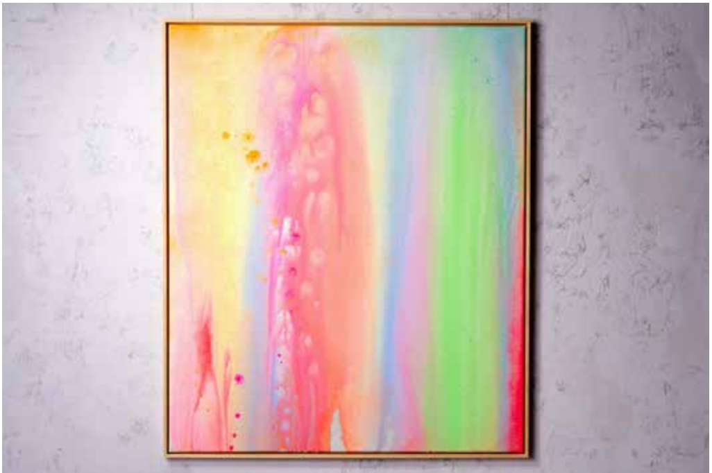
„FLAMBOYANT NO. 1“ Acrylic and Spray Paint on Canvas / 100 x 120 cm / 2025